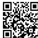
相談フォーム (24時間受付)