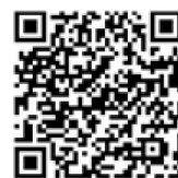
「友だち登録」 二次元コード